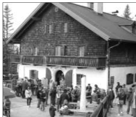
Úton a jégbarlangba