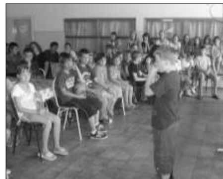
Ki mit tud?

A programok az elmúlt évekhez hasonlóan alakultak. Sportversenyek, kézműves foglalkozások akadályverseny pizsama party, lány és fiú szépségverseny, karaoke, rajzverseny, kisállat be-