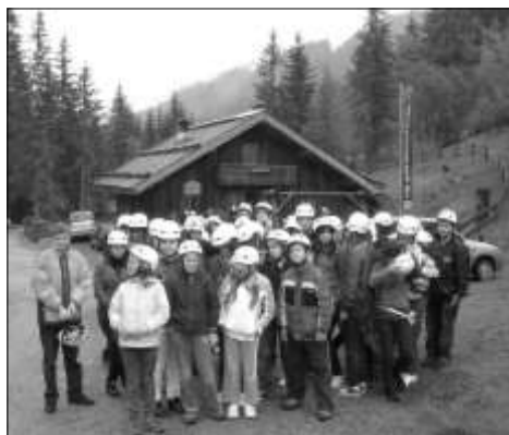
Indulunk a bányába