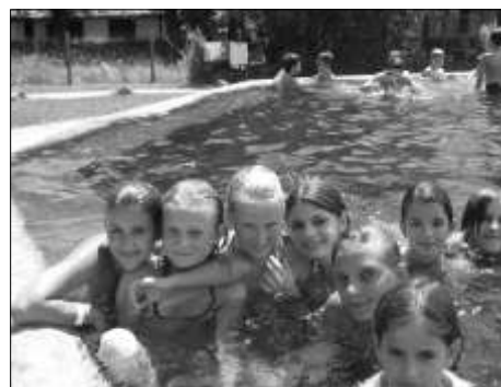
Végre strandidő van!