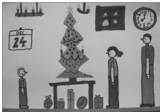
Dékay Gergő rajza 3.b